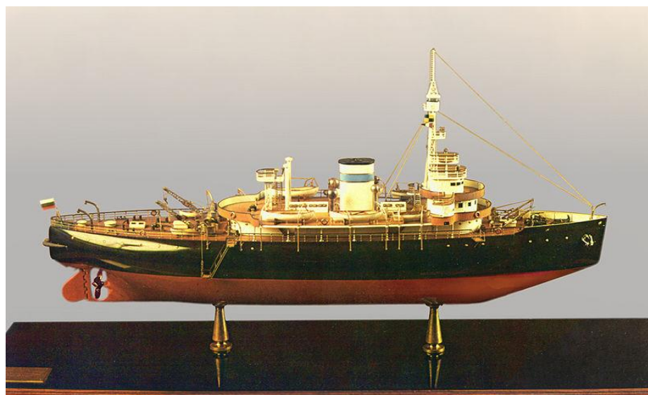
Корабль «Дмитрий Менделеев»

А вывод прост – стихотворение лучше воспринимается, если оно музыкально по сути, и термины «каданс» или «каденция» - в первую очередь музыкальные.