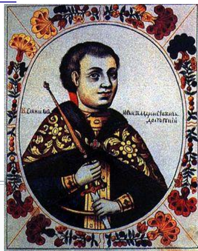
Князь Юрий Владимирович Долгорукий. Портрет из Царского титулярника . 1672 год

В годы его правления впервые в летописях упомянута Москва (1147), где Юрий угощал своего союзника, князя новгород-северского Святослава Ольговича (отца Игоря Святославича , героя Слова о полку Игореве ) [5] . В 1156 Юрий, если верить весьма позднему известию, укрепил Москву рвом и деревянными стенами (так как в это время князь находился в Киеве, непосредственное наблюдение за работами, по-видимому, вёл его сын Андрей Боголюбский , вернувшийся из Вышгорода в 1155 году).