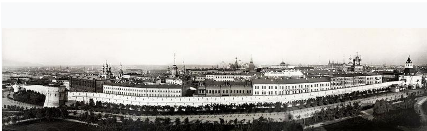
Панорама Китай - города 1887 год.

Очерк «Бани» повествует о банном быте Москвы. Люди со средствами мылись в «дворянских отделениях», рабочие и беднота — в «простонародных» за пятак. Мочалка стоила 13 копеек, мыло продавали по копейке. Существовала корпорация воров, похищавших бельё и обувь у моющихся. В некоторых банях крали даже городскую воду.